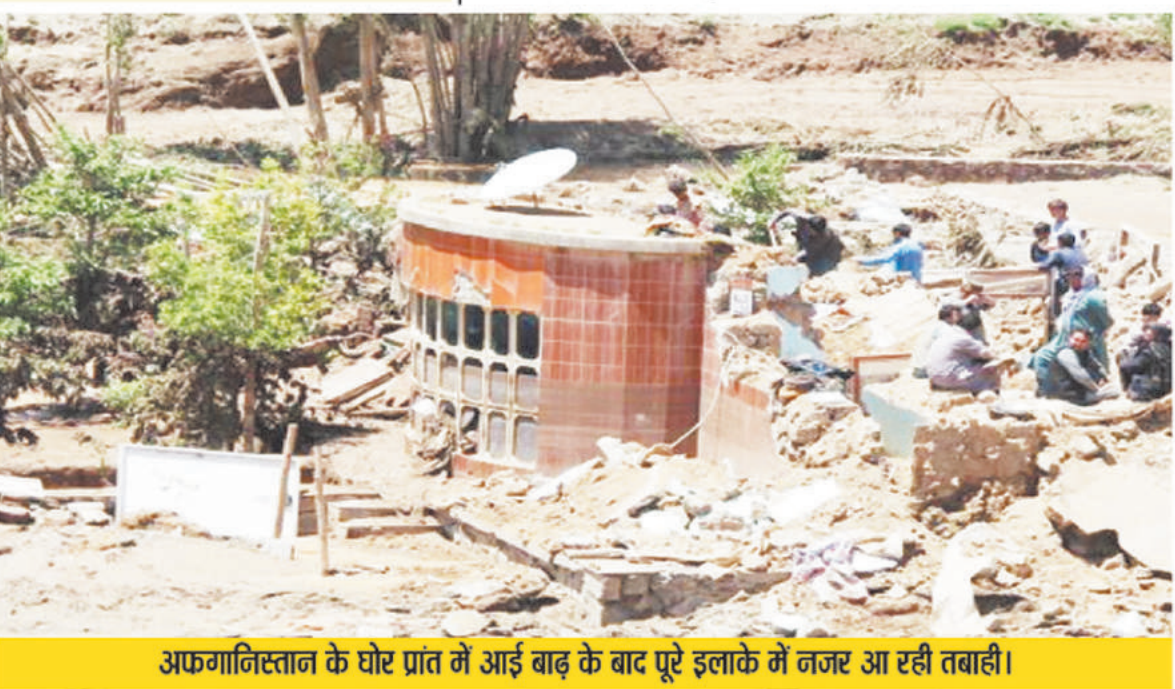
अफगानिस्तान के घोर प्रांत में आई बाढ़ के बाद पूरे इलाके में नजर आ रही तबाही।

काबुल। अफगानिस्तान के घोर और फरयाब प्रांतों में बाढ़ के कारण मरने वालों की संख्या 70 के करीब पहुंच गई है। यह जानकारी दे रहे अफगान के मीडिया सेंटर ने बताया कि घोर में बाढ़ से 50 लोगों की मौत हुई, जबकि फरयाब में बाढ़ के कारण करीब 18 लोग मारे गए हैं, 10 अन्य लापता बताए गए हैं। एक रिपोर्ट के अनुसार फरयाब में 07 अन्य लोगों की भी मौत हुई। इस प्रकार बाढ़ से मरने वालों का अंकड़ा लगातार बढ़ता ही जा रहा है। 10 अन्य लापता हैं। रिपोर्ट में कहा गया कि फरयाब में सात और लोगों की मौत हो गई। यहाँ बतलाते चले कि बाढ़ के कारण सर-ए पोल प्रांत भी प्रभावित हुआ है।