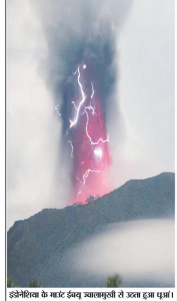
इंडोनेशिया के माउंट इंब्यू ज्वालामुखी से उड़ता हुआ धूआं।

पर सरकारी अधिकारियों पर क्रिमिनल केस दर्ज किया जाएगा। इसी बिल पर वोटिंग से ठीक पहले नए राष्ट्रपति चिंग ते की डेमोक्रेटिक प्रोग्रेसिव पार्टी और चीन समर्थक विपक्ष की कुमेन्तांग पार्टी के लोगों के बीच झड़प हो गई। जब सांसद सदन में पहुंचे तो वे एक-दूसरे पर लड़ाई करने का आरोप लगाने लगे। दरअसल, 20 मई को ताइवान के नए राष्ट्रपति लाई चिंग ते राष्ट्रपति पद की शपथ लेने वाले हैं। हालांकि, उनकी पार्टी डीपीपीके पास संसद में बहुमत नहीं है। ताइवान की मुख्य विपक्षी पार्टी केएमटी के पास डीपीपीके ज्यादा सीटें हैं।