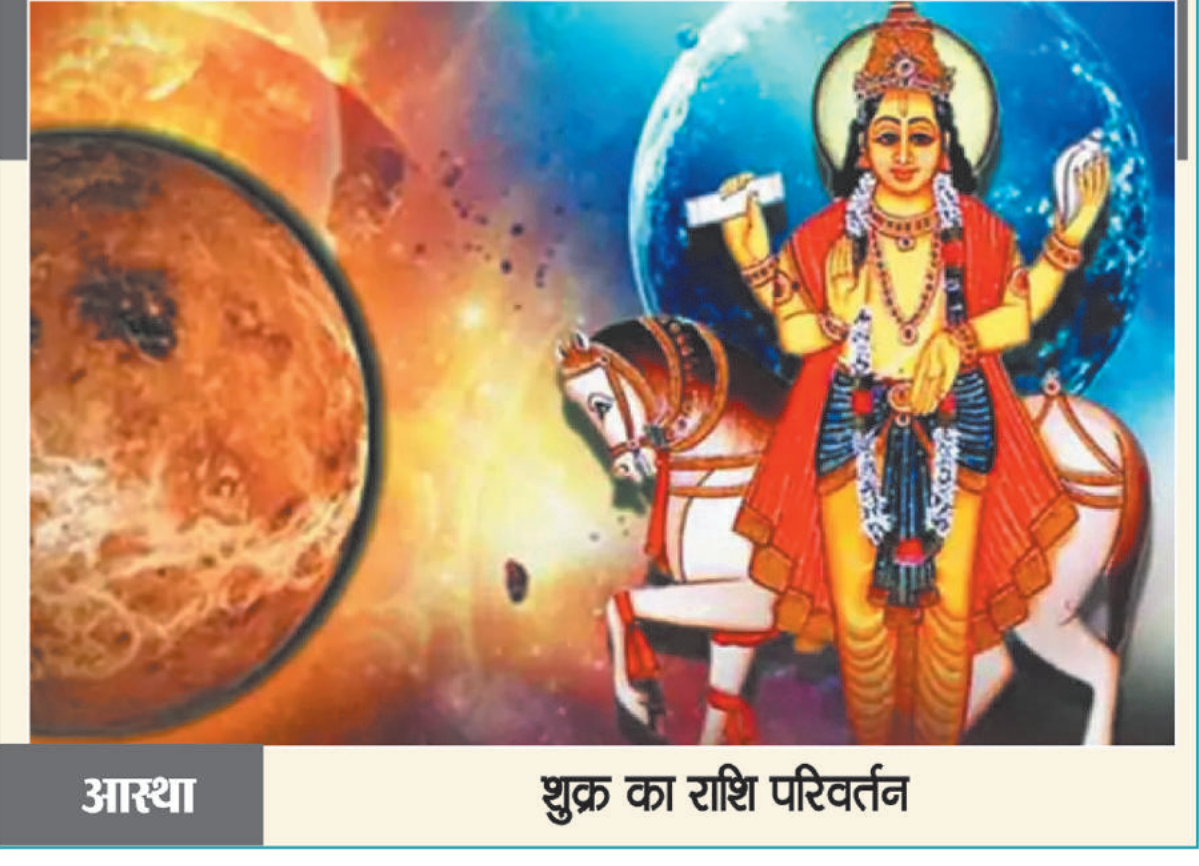
आस्था शुक्र का राशि परिवर्तन