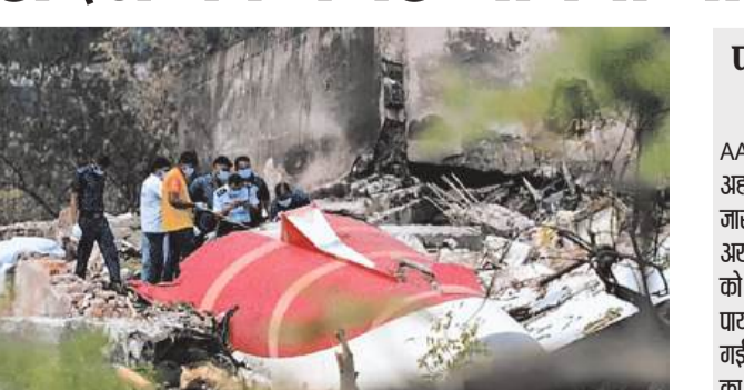
निजी तौर पर परिवारों के साथ साझा किया जाए। 12 जून 2025 को अहमदाबाद से लंदन जा रहा बोइंग 787-8 विमान टेकऑफ के तुरंत बाद मेडिकल कॉलेज हॉस्टल पर गिर गया था। इस हादसे में 241 यात्री और 19 अन्य लोगों समेत कुल 260 लोगों की मौत हुई थी।

नई दिल्ली, एप्रैली अहमदाबाद में एअर इंडिया प्लेन क्रैश के 10 महीने बाद करीब 30 पीड़ित परिवारों ने शनिवार को प्रधानमंत्री नरेंद्र मोदी को लेटर लिखा है। उन्होंने पीएम से फ्लाइट का ब्लैक बॉक्स और कॉकपिट वॉयस रिकॉर्डर डेटा सार्वजनिक करने की मांग की है। परिवारों ने कहा, हमें पैसे नहीं चाहिए। हमें सच्चाई जाननी है। हम जानना चाहते हैं कि हादसा क्यों हुआ और क्या इसमें कोई तकनीकी खराबी थी। परिवारों का कहना है कि अगर ब्लैक बॉक्स डेटा सार्वजनिक नहीं किया जा सकता, तो हम से कम इसे