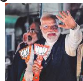
अमित शाह ने केरल के बेपौर में रौड शो किया

कोलकाता, एप्रैली प्रधानमंत्री नरेंद्र मोदी रविवार को कुर्चबिहार में रेली के साथ पश्चिम बंगाल में भाजपा के चुनाव अभियान की शुरुआत करेंगे। वे दोपहर में रास मेला मैदान में आयोजित 'विजॉय संकल्प सभा' को संबोधित करेंगे। रेली में मोदी 'विकसित बंगाल' का विजन पेश करेंगे और शासन, कानून-व्यवस्था और भ्रष्टाचार जैसे मुद्दों पर झूठ सरकार को घेर सकते हैं। यह विधानसभा चुनाव की घोषणा के बाद राज्य में उनकी पहली चुनावी रेली होगी। मोदी ने आखिरी बार 14 मार्च को राज्य का दौरा किया था, जहां उन्होंने कोलकाता के ब्रिगेड परेड ग्राउंड में एक रेली को संबोधित किया था और लगभग 18,680 करोड़ की विकास परियोजनाओं का उद्घाटन किया था। इधर, तमिलनाडु सीएम स्टालिन ने चुनावी रेली में NDA को खुली चुनौती दी। कहा- असर पीएम मोदी, गृह मंत्री शाह और शिक्षा मंत्री प्रधान में हिम्मत है तो वे चुनाव प्रचार के दौरान राज्य में 3-भाषा नीति लागू करने की घोषणा करें। TMC संसद महूआ मोइजा के गुजराती समुदाय पर दिए बयान से पार्टी ने किनारा कर लिया है। पार्टी प्रवक्ता कुपाल घोष ने कहा कि पार्टी इस तरह के विचारों का समर्थन नहीं करती। दरअसल, मोइजा ने एक प्रेस कॉन्फ्रेंस में कहा- बंगालियों ने आजवादी की लड़ाई में नेतृत्व किया। गुजराती कौन थे? क्या आप एक भी गुजराती का नाम बता सकते हैं, सिवाय वीर सावरकर के, जो माफ़ी पत्र लिखना चाहते थे?