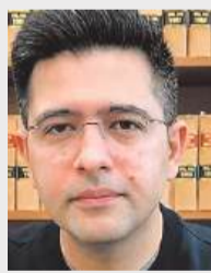
उन्होंने यह भी सवाल उठाया कि पार्टी के अन्य नेताओं ने भी इस पर हस्ताक्षर नहीं किए, फिर केवल उन्हें ही निशाना क्यों बनाया जा रहा है।

उन्होंने यह भी सवाल उठाया कि पार्टी के अन्य नेताओं ने भी इस पर हस्ताक्षर नहीं किए, फिर केवल उन्हें ही निशाना क्यों बनाया जा रहा है। 3. उरने और मुद्दों से भटकने का आरोप: इस आरोप पर उन्होंने कहा कि वह संसद में शोर मचाने के लिए नहीं, बल्कि जनता के मुद्दे उठाने के लिए गए हैं। बेरोजगारी, महंगाई और आम लोगों से जुड़े मुद्दों को उन्होंने लगातार उठाया है।