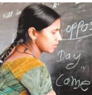
सेवा समाप्ति या सेवानिवृत्ति की स्थिति उत्पन्न हो सकती है, इससे शिक्षक चिंतित हैं।उनका यह भी कहना है कि सुप्रीम कोर्ट का निर्णय महाराष्ट्र से संबंधित था और मध्य प्रदेश इस मामले

भोपाल प्रदेश के पूर्व मुख्यमंत्री एवं राज्य सभा सदस्य दिग्विजय सिंह ने मुख्यमंत्री डा. मोहन यादव को पत्र लिखकर प्रदेश के शासकीय स्कूलों में कार्यरत दो लाख से अधिक शिक्षकों के हित में शिक्षक पात्रता परीक्षा (टीईटी) पर पुनर्विचार करने के लिए कहा है। उन्होंने लिखा है कि सुप्रीम कोर्ट के हालिया निर्णय के संदर्भ में राज्य सरकार को रिव्यू पिटीशन या क्यूरेटिव पिटीशन दायर कर टीईटी अनिवार्यता को भूतलक्षी के बजाय भविष्यलक्षी प्रभाव से लागू करने की मांग करनी चाहिए। परीक्षा में असफल रहने पर