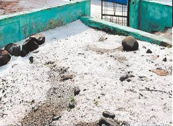
पूरे महीने जारी रह सकता है असर

नई दिल्ली/भोपाल अप्रैल की शुरुआत में ही उत्तर भारत का मौसम अचानक बदल गया है। सक्रिय पश्चिमी विक्षोभ के प्रभाव से रूढ़ ऋतु, उत्तर प्रदेश, राजस्थान, हरियाणा और दिल्ली-एनसीआर समेत कई राज्यों में तेज बारिश, आंधी और ओलावृष्टि देखने को मिल रही है। इससे किसानों की चिंता बढ़ गई है। आज छत्तीसगढ़, पंजाब, हरियाणा, दिल्ली-एनसीआर और पश्चिमी उत्तर प्रदेश के कई इलाकों में मध्यम से भारी बारिश और ओलावृष्टि की संभावना जताई गई है। दोपहर और शाम के समय गरज-चमक के साथ तेज बारिश हो सकती है। ध्य प्रदेश में प्रेरित चक्रवात के प्रभाव से कई जिलों में ऑरेंज और रेड अलर्ट जारी किया गया है। वेस्टर्न डिस्टर्बेंस के असर से शनिवार को भी कई जिलों में देर शाम घने बादल छाए, तेज हवा चलने के साथ बारिश और आले तिरों जयपुर में 32रू से ज्यादा बरसात हुई।