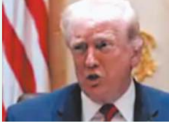
अमेरिकी सैन्य कार्रवाई की नाकामी को दिखाती है। वहीं, ईरानी अधिकारियों ने कहा

तेहरान/वाशिंगटन, एप्रैली ईरान के एक सुरक्षा अधिकारी ने अमेरिका और इजराइल को चेतावनी देते हुए कहा, हमारे पास अमेरिका और इजराइल के लिए बड़ा सरप्राइज है, बस थोड़ा इंतजार करना होगा। फार्स न्यूज एजेंसी के अनुसार, उन्होंने अमेरिका के निशानों को गलत बताया और पुलों पर हमले की टिप्पणी की धमकी को मजाकिया कहा। उन्होंने कहा कि यह धमकियां